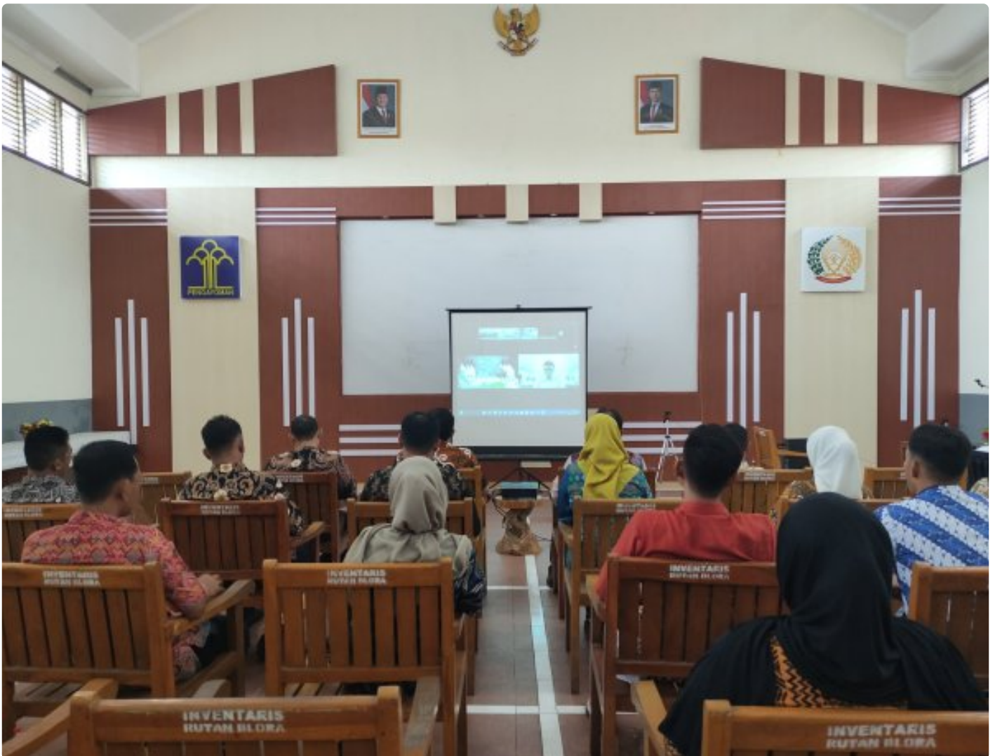
ASN Rutan blora ikuti pengrahan menteri kemenimipas

Blora - Rumah Tahanan Negara (Rutan) Kelas IIB Blora melaksanakan kegiatan pengarahan yang disampaikan langsung oleh Menteri Imigrasi dan Pemasarakatan, Agus Andrianto. Kegiatan ini diikuti oleh seluruh ASN di