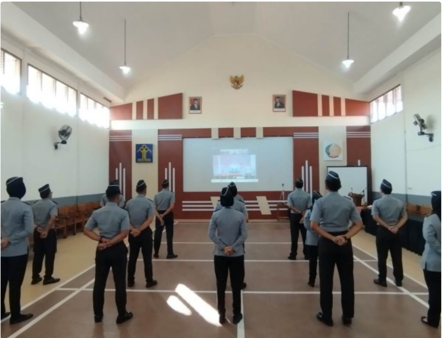
Rutan Blora Ikuti Apel Pagi Perdana Menkumham RI secara Virtual

Blora - Rumah Tahanan Negara (Rutan) Kelas IIB Blora mengikuti kegiatan Zoom Apel Perdana Menteri Hukum dan Hak Asasi Manusia Republik Indonesia, Supratman Andi Agtas. Kegiatan ini diikuti dengan penuh semangat oleh Kepala Rutan, pejabat struktural, dan seluruh pegawai Rutan Kelas IIB Blora, menunjukkan komitmen dan kesiapan mereka dalam menjalankan tugas. Senin